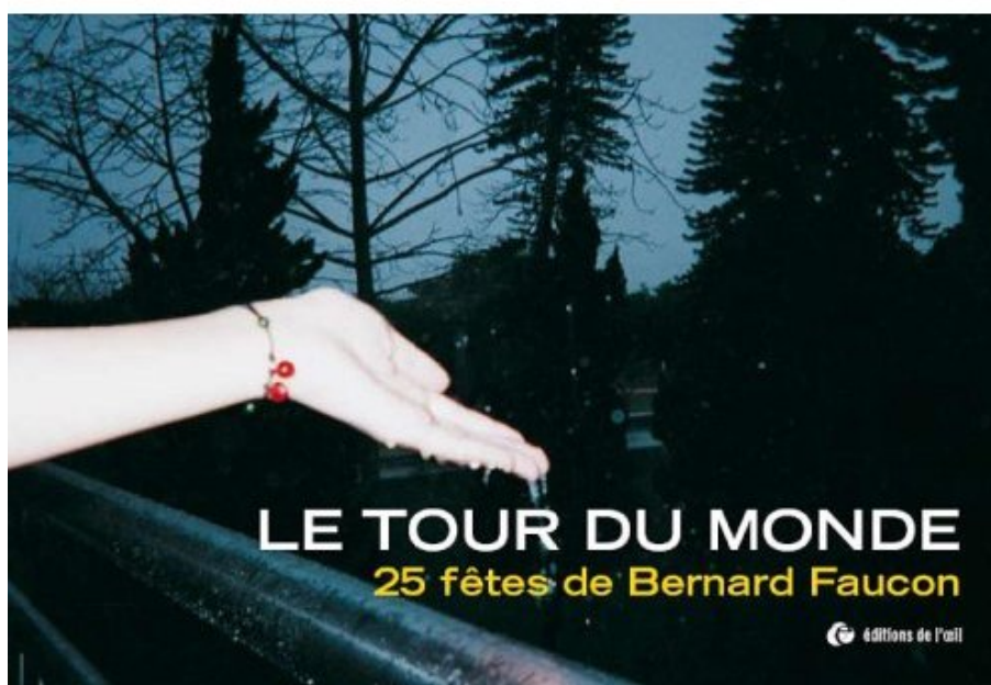
Le Tour du Monde 25 Fetes de Bernard Faucon

Filles et garçon du monde entier se photographient le temps d'une fête. Bernard Faucon a interrompu en 1995 son oeuvre de photographe metteur en scène. Depuis lors, il a organisé des fêtes photographiques tout autour du monde, toujours sur le même principe : une seule journée, un seul lieu, une centaine de garçons et de filles de quinze à vingt ans munis d'un appareil jetable ou numérique, une totale liberté : « photographiez-vous vous-mêmes, photographiez ce qui vous plaît... » Allemagne, Brésil, Cambodge, Chine, Corée, Cuba, France, Italie, Japon, Java, Liban, Mali, Maroc, Myanmar, Pologne, Réunion, Russie, Suède, Syrie, Taïwan, Thaïlande, Tunisie, Turquie : 25 fêtes ont eu lieu, mais il n'y en aura pas d'autres et ce livre clôture ces moments « d'éternité retrouvée » en une farandole d'images qui court sur deux millénaires, vingt-cinq théâtres du monde, avec quelques deux mille cinq cent jeunes gens !