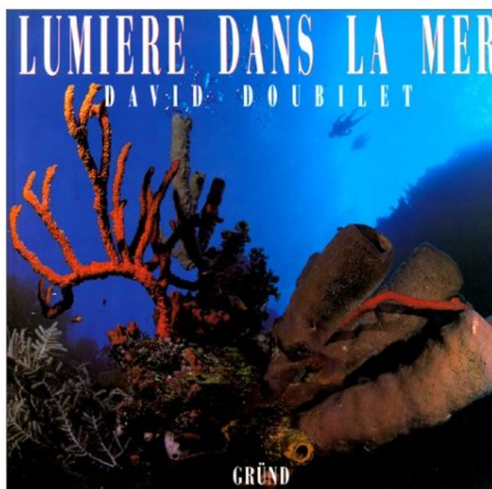
Lumière dans la mer de David Doubilet