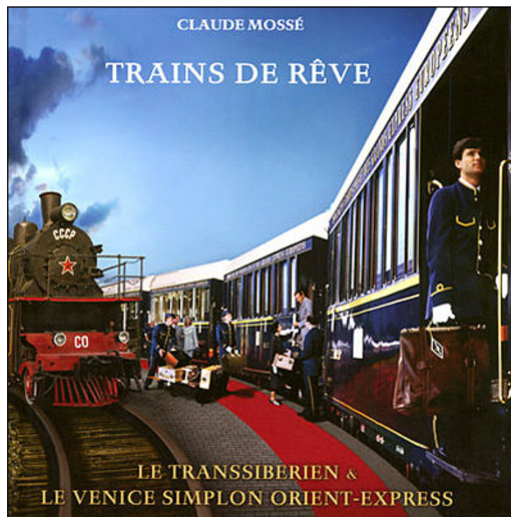
Trains de rêve : Le Transibérien et le Venice Simplon Orient-Express de Claude Mossé

A travers les vitres de l'un ou l'autre train, sur la lagune de Venise la Sérénissime ou les rives du lac dieu Baïkal, près d'Irkoutsk, le passager renoue les fils de la Nature et des Hommes. Le Transsibérien, le VSOE... Après avoir achevé la dernière page de ce beau livre, accompagné d'un DVD tourné en 2007, comment résister à l'envie de boucler les valises ?