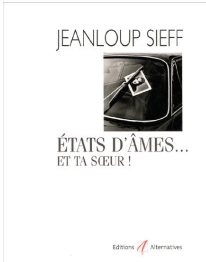
Etats d'âme et ta soeur de Jean-Loup Sieff