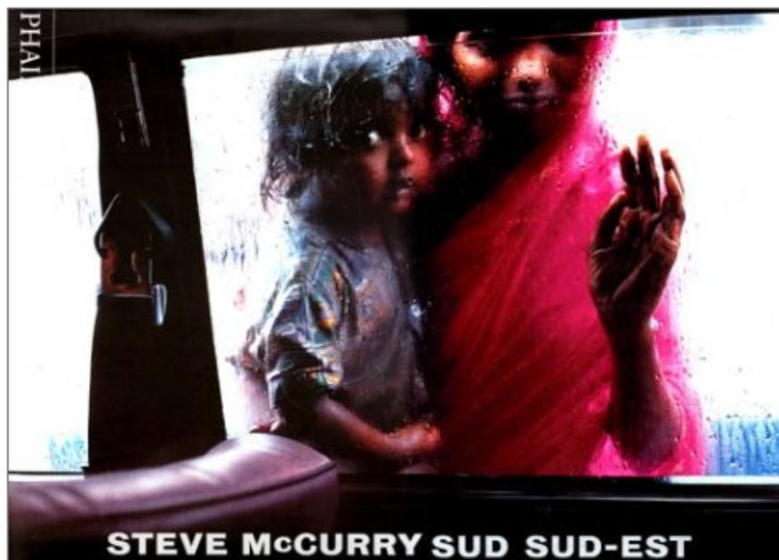
Sud sud-est de Steve Mc Curry

Il est très connu pour sa photographie en couleur très évocatrice, dans la tradition du reportage documentaire.