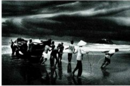
Sebastiao Salgado, homme et eau

Dans l'essai de accompagnement lyrique, Salgado (une grâce incertaine) déplore la pêche industrielle du Japon qui décime les stocks halieutiques, les politiques agricoles de la France et l'exploitation globale des travailleurs manuels qui effectuent la partie du travail du monde.