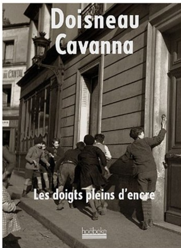
Les doigts pleins d'encre de Robert Doisneau, François Cavanna

Un clin d'œil drôle et touchant, qui rappellera aux uns d'émouvants souvenirs, aux autres que leurs parents ne furent pas toujours adultes.