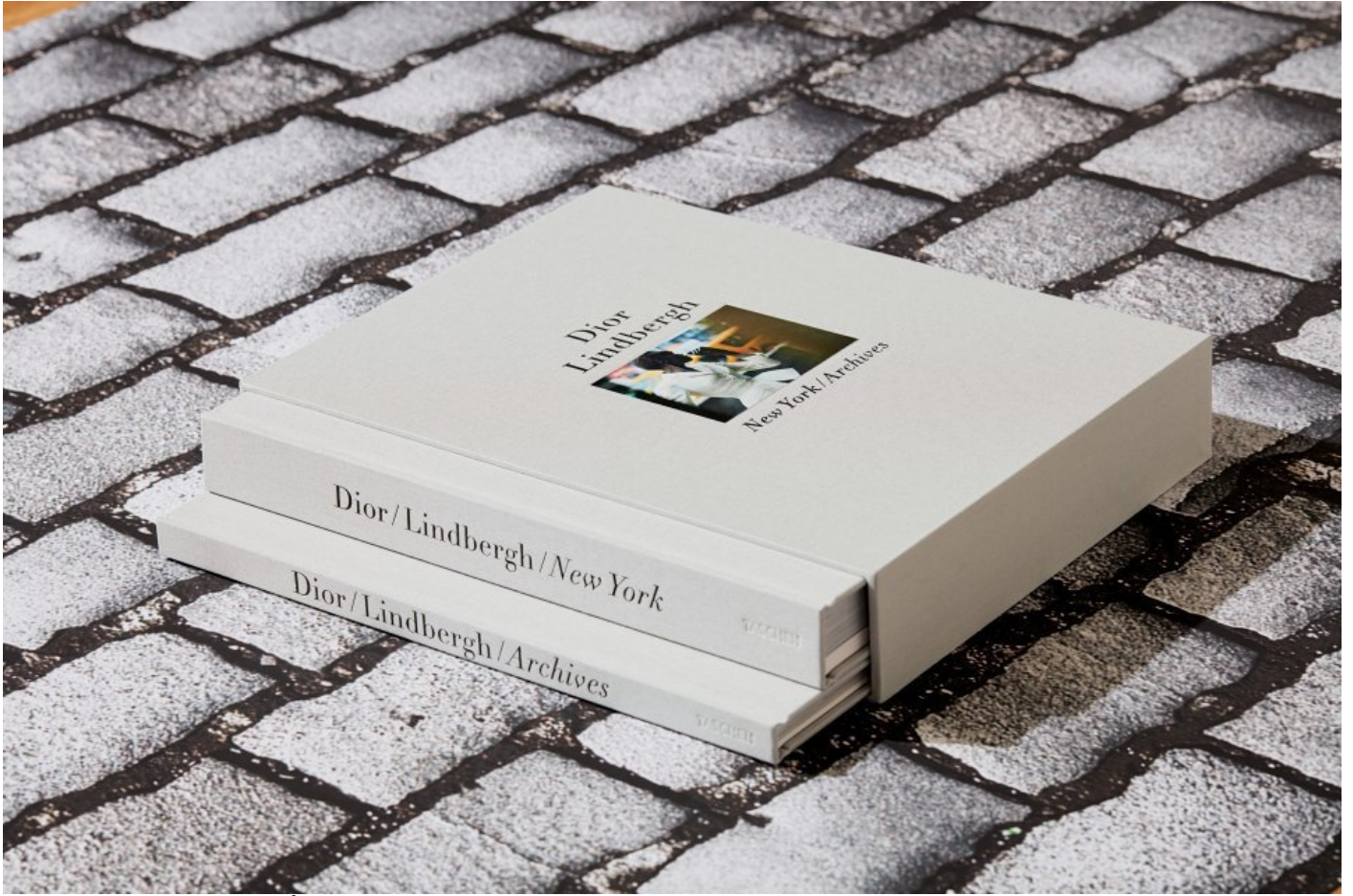
Peter Lindbergh. Dior © Peter Lindbergh