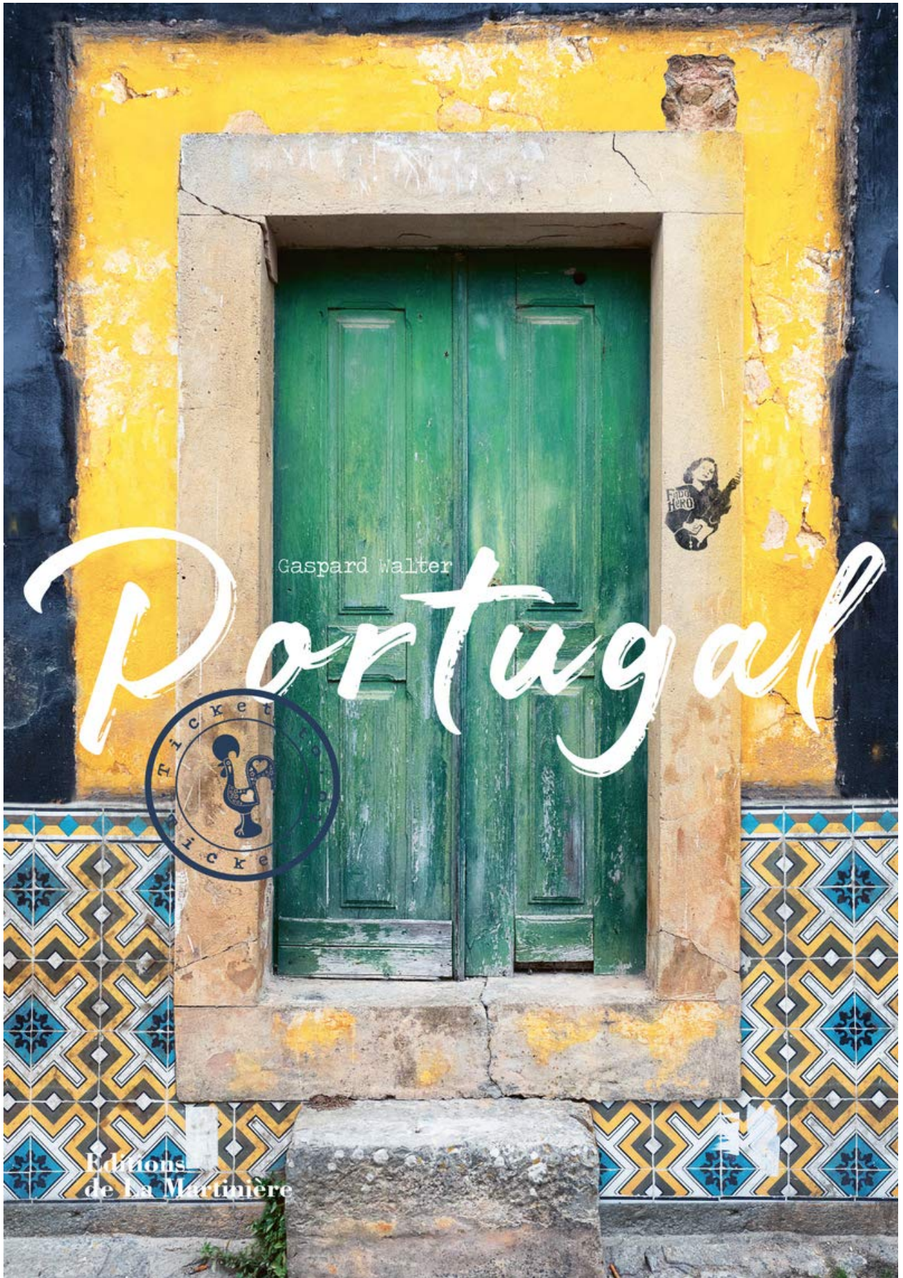
Ticket to Portugal