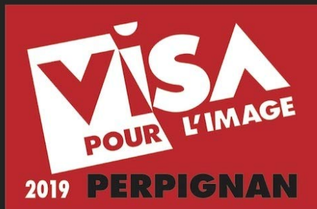
Visa pour l'image 2019 Jean-François Leroy