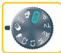
Prise de vue