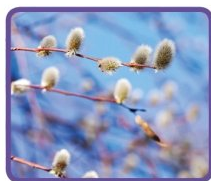
Mise au point