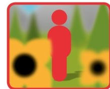
Balance des blancs