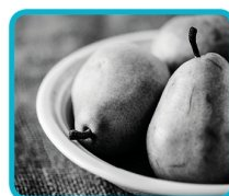
Noir et blanc