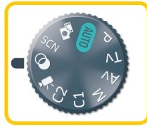
Prise de vue