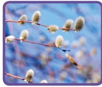
Mise au point