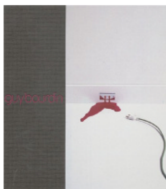
Guy Bourdin de Guy Bourdin, Charlotte Cotton, Shelly Verthime

Cet ouvrage est publié à l'occasion de l'exposition consacrée au photographe et présentée au Jeu de Paume, à Paris, du 23 juin au 13 septembre 2004.