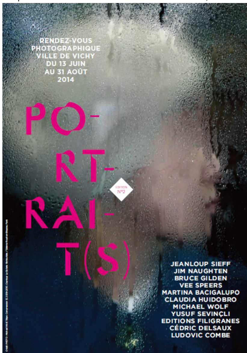
Portrait(s) - Edition N°2

Dans la série « Tokyo Compression » le photographe allemand Michael Wolf a observé les voyageurs dans le métro bondé de la capitale nipponne, cadrant les corps et les visages comprimés par le nombre, produisant des images oppressées qui ne sont pas sans évoquer les « accumulations » du sculpteur Arman. Saisissant comme personne le blues des mégalo-poles, il s'est peut-être souvenu aussi des photos que Walker Evans avait prises dans le métro new-yorkais dans les années 30, où, déjà, les regards absents des voyageurs traduisaient le stress du citadin. Dans ces images plus closes qu'une porte de prison, les laborieux des villes, yeux clos, joues plaquées contre les vitres ruisselantes, semblent condamnés chaque jour à revivre, au cœur même de la foule, l'expérience de l'ultra solitude. Michael Wolf est représenté par La Galerie Particulière / Galerie Foucher-biousse, Paris.