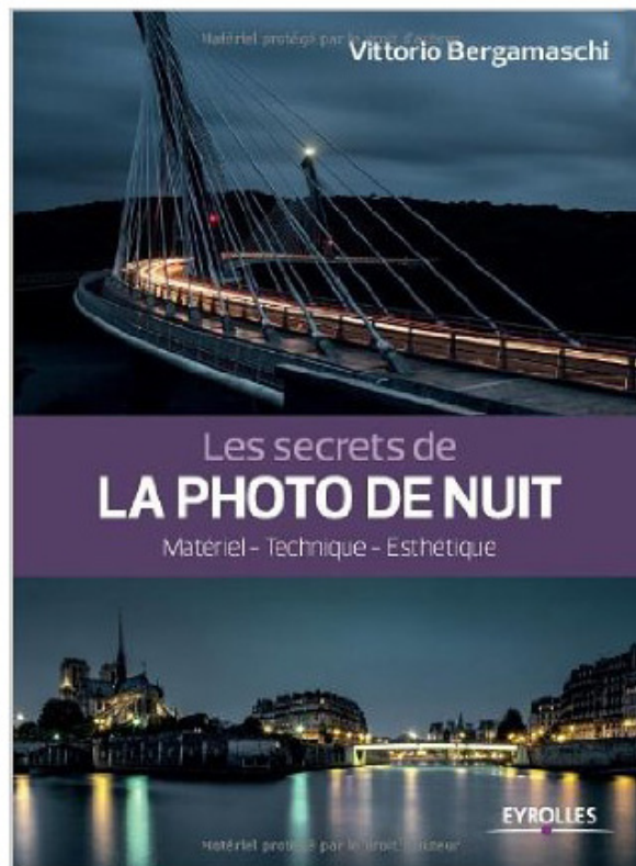
Les secrets de la photo de nuit de Vittorio Bergamaschi

Guidés par les conseils de Vittorio Bergamaschi, vous saurez progressivement faire les bons réglages, apprentissage indispensable pour retranscrire fidèlement les couleurs de la nuit ou au contraire transfigurer le réel pour créer des scènes oniriques ou mystérieuses et utiliser le matériel adéquat.