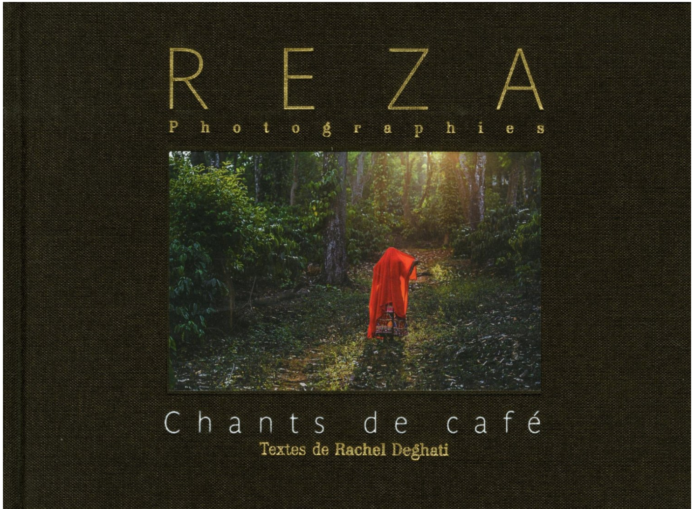
Les chants de café de Reza, Deghati Rachel