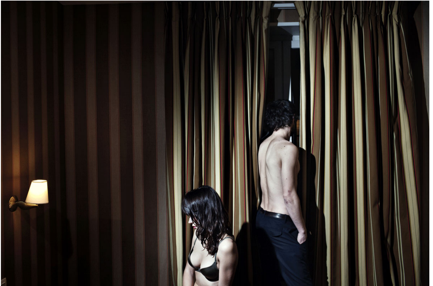
Sans titre