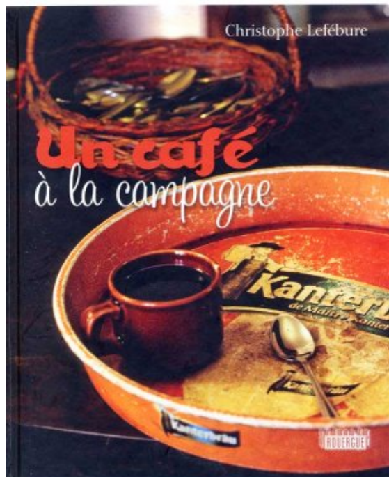
Un café à la campagne de Christophe Lefébure

On y bat les cartes, on y jette les dés. Les jours de fête, l'assemblée s'y donne rendez-vous et tangué au son de l'accordéon. Les jours d'élection, ils se transforment en vraie tribune politique. A travers photos et lieux et portraits, un instantané de la mémoire accompagné d'un texte qui court à travers l'histoire de ces cafés un brin enchantés.