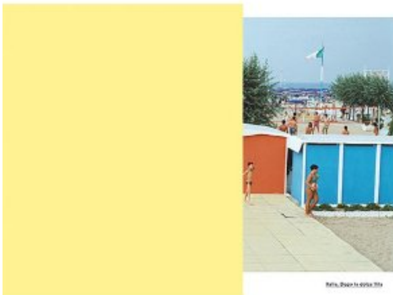
Italia, Dopo la dolce vita