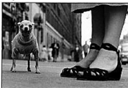
Visa pour l'image 2006