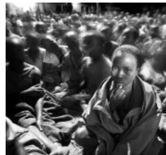
Visa pour l'image 2006

Festival International du Photojournalisme de Perpignan est une Association, loi 1901, voit le jour en 1989 regroupant ainsi tous les institutionnels concernés. D'emblée le Festival International du Photojournalisme à Perpignan remporte un vif succès, soutenue par Paris-Match et Photo (Groupe Filipacchi Médias dirigé par Roger Théron). Le Ministère de la Culture, Kodak, Canon et les partenaires locaux sont venus ensuite apporter leur soutien. En 1997, une nouvelle structure s'est mise en place. Compte tenu de l'ampleur de la manifestation, il s'avérait que le mode de gestion instauré n'était plus à l'échelle du fonctionnement de la manifestation. Le Festival est organisé à l'initiative de l'Association Visa pour l'Image - Perpignan, maître d'ouvrage de la manifestation. Le maître d'oeuvre est la Société Images Evidence, filiale du groupe Hachette-Filipacchi Médias. Cette association regroupe la ville de Perpignan, le Conseil Général des Pyrénées-Orientales, la Région Languedoc Roussillon, la Chambre de Commerce et d'Industrie de Perpignan, la Chambre des Métiers et la Chambre d'Agriculture, l'Union Patronale 66, ainsi que des personnes physiques es-qualité.