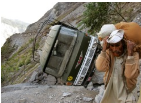
Visa pour l'image 2006