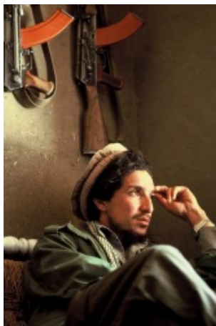
Visa pour l'image 2006

Ces photos nous parlent aussi de nature et d'environnement, de peuples, de religions, de faits de société, ou encore des grands fléaux de notre époque. Comme chaque année le World Press Photo, concours de référence du Photojournalisme mondial est présent à Perpignan. Il faut noter également que pour chaque édition les journaux français et internationaux exposent leurs meilleures images de l'année. N'oublions pas les laboratoires photographiques qui nous ont permis depuis la création du festival de produire près de 450 expositions qui ont enregistré plus de 2,5 millions d'entrées.