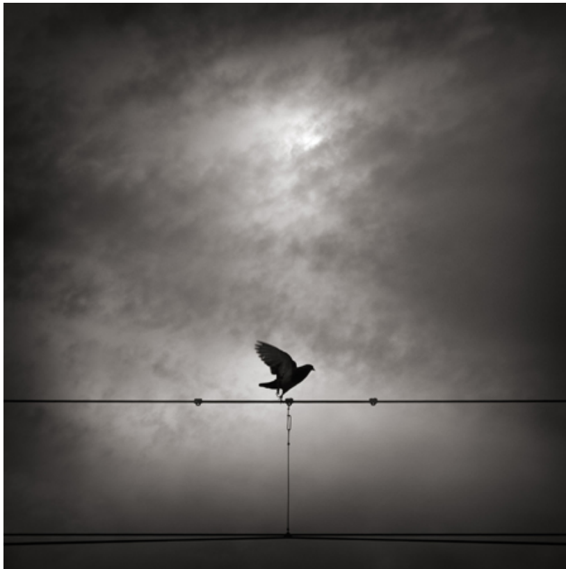
ZOOM de la Presse Photo