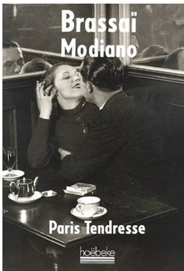
Paris tendresse de Brassai, Patrick Modiano

Brassai et Modiano ne sont pas contemporains, pourtant, bien des images de Brassai inspirent ce grand romancier, qui voit dans ces photos comme à travers une boule de cristal. Modiano est convaincu de retrouver ici les souvenirs d'une époque qu'il recherche et qu'il aime faire redécouvrir au lecteur.