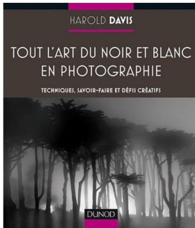
Tout l'art du noir et blanc en photographie de Harold Davis