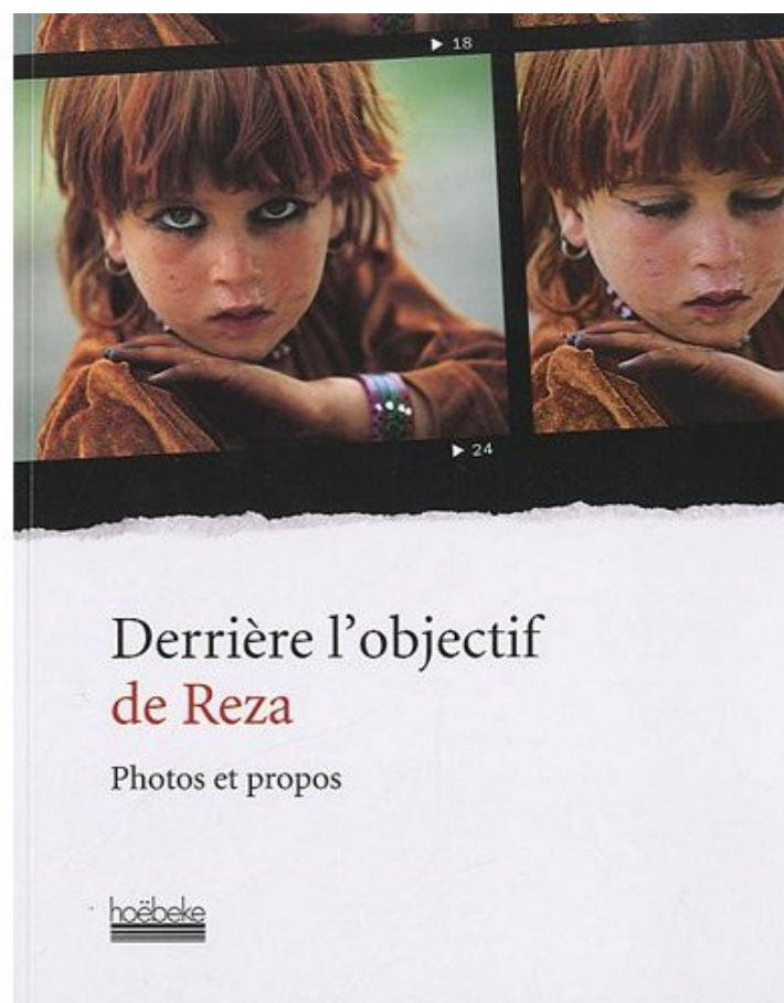
Derrière l'objectif de Reza de Reza

Dans cet ouvrage, le photographe nous fait entrer dans son univers, derrière son objectif, commentant une centaine de photographies emblématiques de son parcours. Reza retrace les étapes de la création en révélant le contexte d'une prise de vue, son intention, le choix d'une technique ou d'un cadrage, et éclaire ainsi son travail d'un jour nouveau.