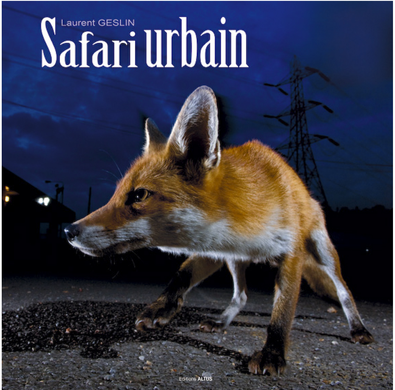
Safari urbain de Laurent Geslin

Safari urbain nous invite à découvrir le monde inconnu et mystérieux de notre jungle urbaine. Un monde où les animaux se sont adaptés à la proximité de l'homme sans que celui-ci ne s'en aperçoive vraiment.