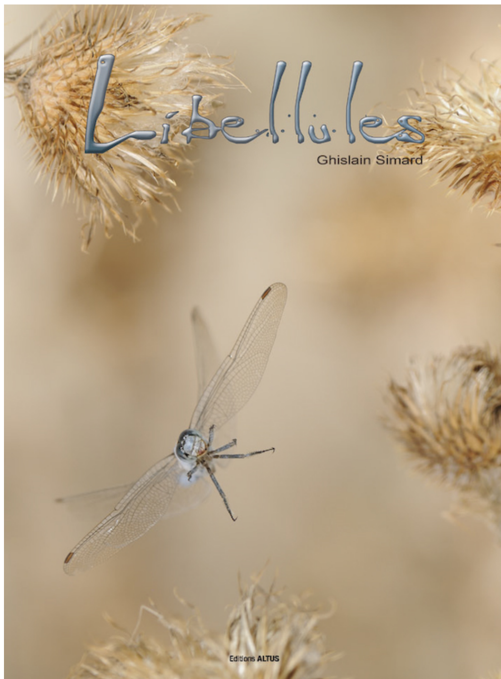
Libellules de Ghislain Simard

Les clichés de Ghislain Simard ouvrent une porte sur ce monde où les actions sont trop rapides pour être observées à l'oeil nu. L'objectif du photographe nous fait voyager dans des paysages en miniature, sur un étang, près d'un canal, au-dessus d'un ruisseau, le long d'un fleuve ou dans une tourbière. Les chapitres sont rythmés par la diversité des comportements : le frêle Agrion est imprévisible, la Libellule déprimée revient toujours sur le même perchoir, les orthétrums s'accouplent en plein vol, le sympétrum joue avec les reflets sur l'eau tandis que l'anax montre sa puissance.