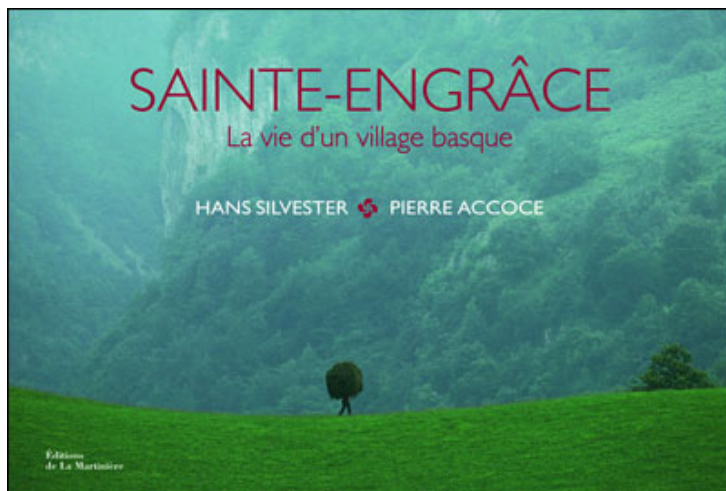
Sainte-Engrâce : La vie d'un village basque d'Hans Silvester, Pierre Accoce

La passion qu'il voue à sa région natale des Pyrénées l'amène à écrire plusieurs articles sur le sujet, pour le magazine GEO notamment.