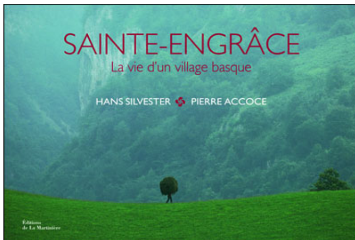
Sainte-Engrâce : La vie d'un village basque d'Hans Silvester, Pierre Accoce

La passion qu'il voue à sa région natale des Pyrénées l'amène à écrire plusieurs articles sur le sujet, pour le magazine GEO notamment.