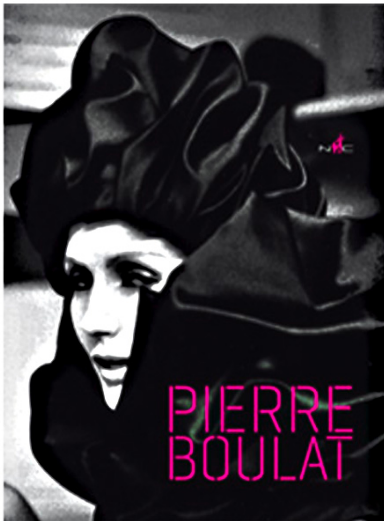
Pierre Boulat de Pierre Boulat

Cet ouvrage rassemble ses meilleurs clichés.