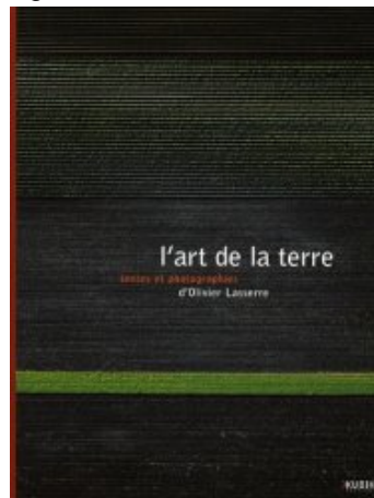
L'art de la terre de Olivier Lasserre

A côté de ce superbe travail artistique, Olivier Lasserre donne la parole à ceux qui façonnent les paysages de notre siècle, du vieux paysan exploitant la ferme de ses arrière-grands-parents jusqu'à l'ingénieur agronome qui anticipe les profondes mutations de l'industrialisation agricole.