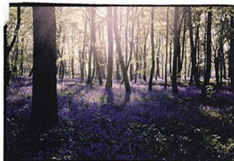
Postproduction couleur de Steve MacLeod