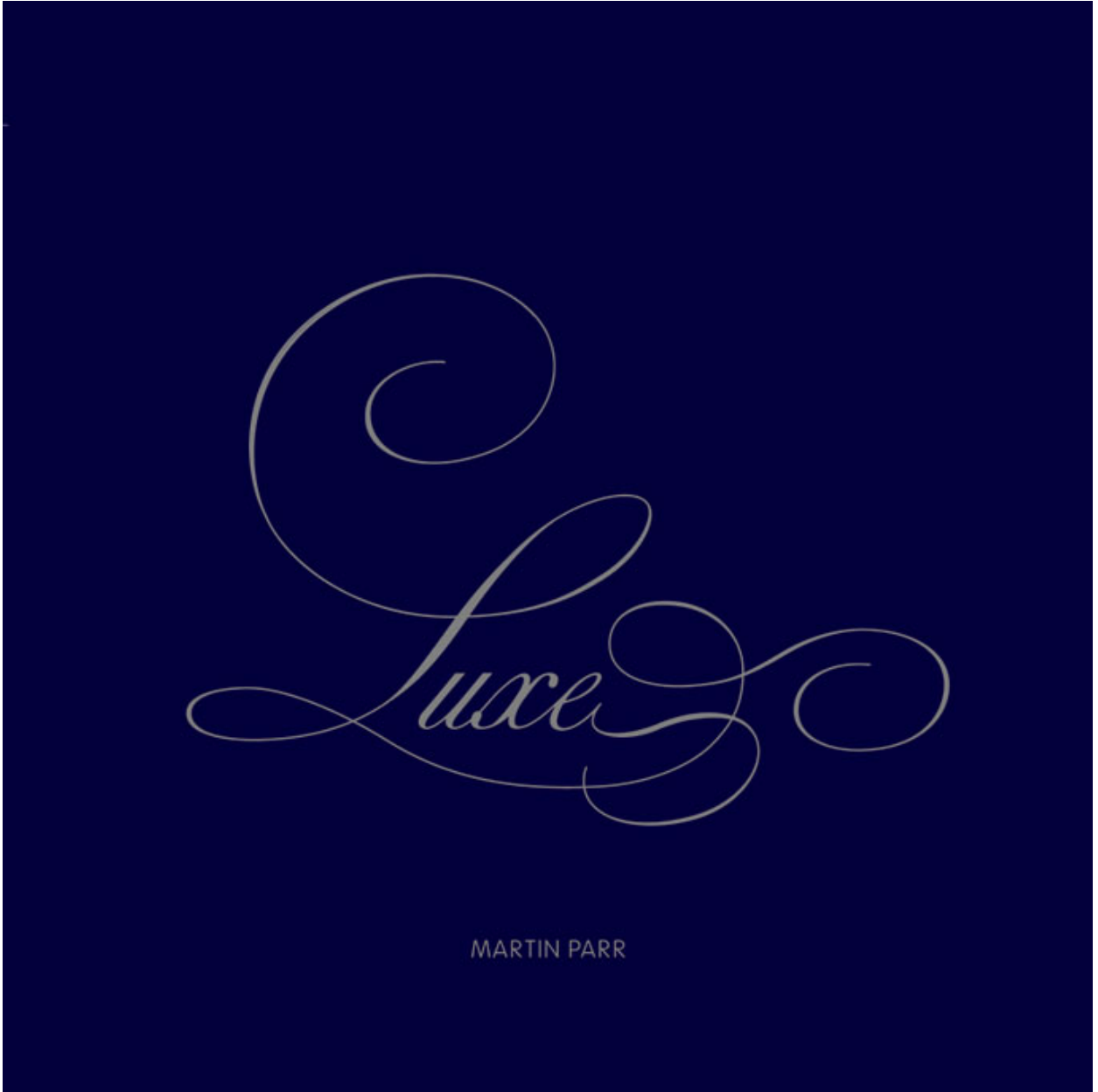
Luxe de Martine Parr