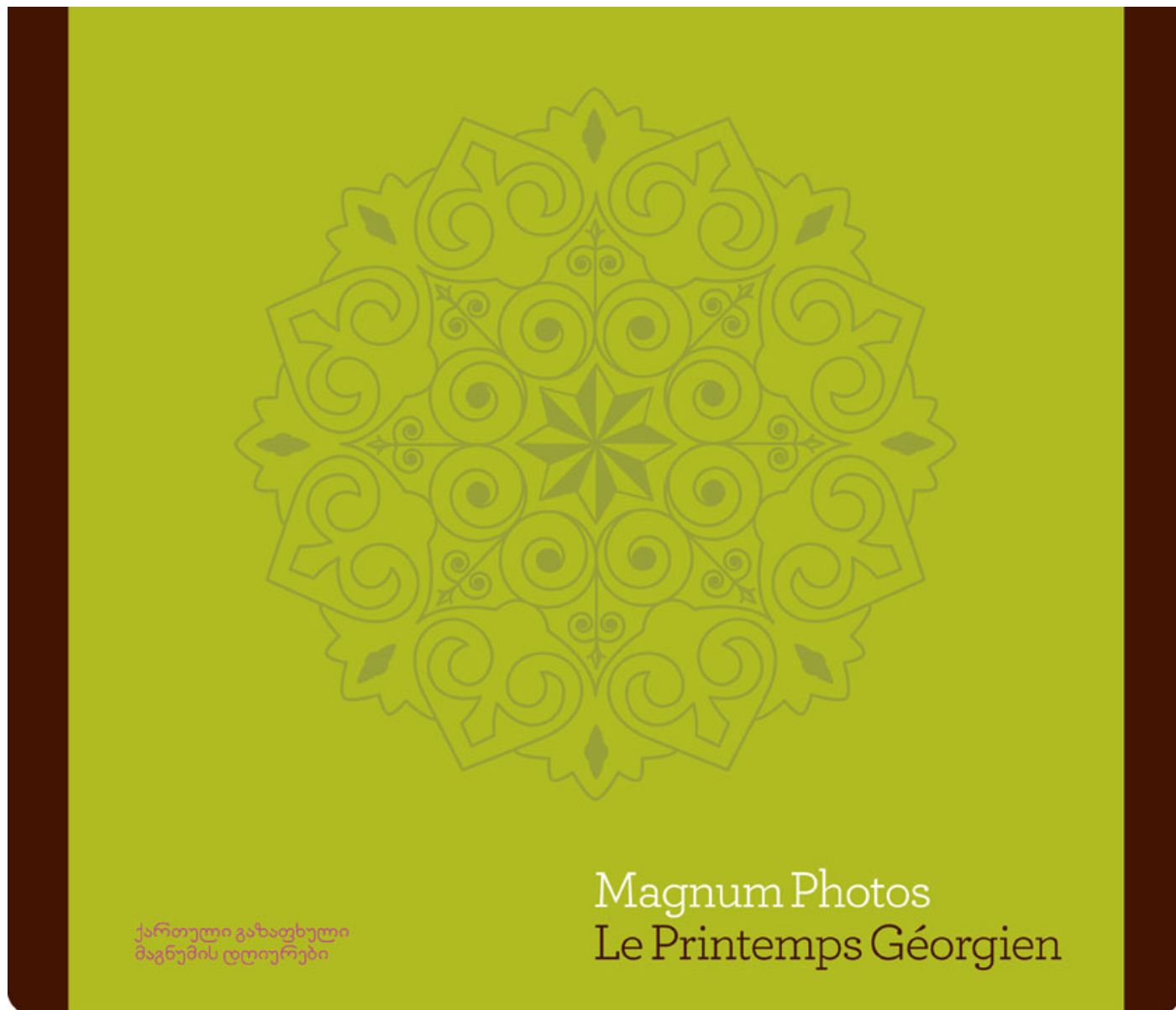
Un Printemps Géorgien photographes de l'agence Magnum