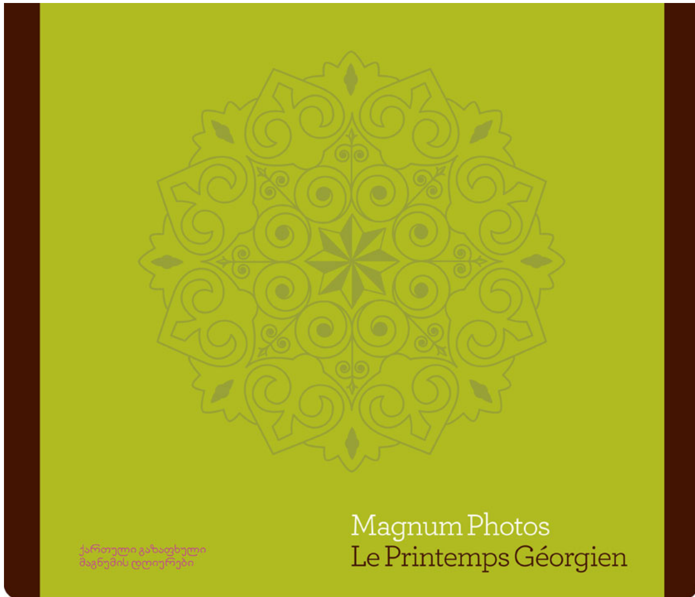
Un Printemps Géorgien photographes de l'agence Magnum