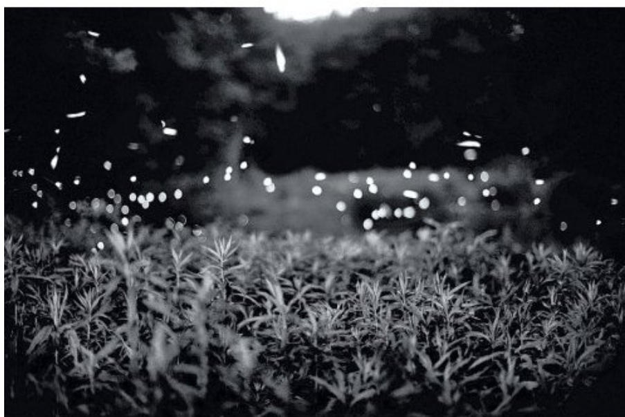
Gregory Crewdson Fireflies