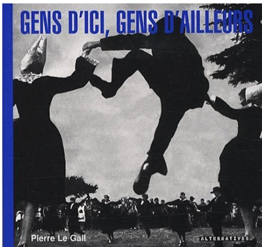
Gens d'ici, gens d'ailleurs de Pierre Le Gall

Pierre Le Gall a choisi dans Gens d'ici Gens d'ailleurs de mettre en correspondance une France de toujours avec des personnages de tous les continents.