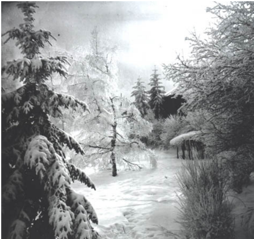
Lartigue en Hiver de Jacques Henri Lartigue

Magnifiquement reproduite en bichromie, cette collection de photographies d'hiver, dont la plupart sont publiées pour la première fois, comblera tous ceux qui s'intéressent à l'univers de la photographie et les sports de haute montagne.