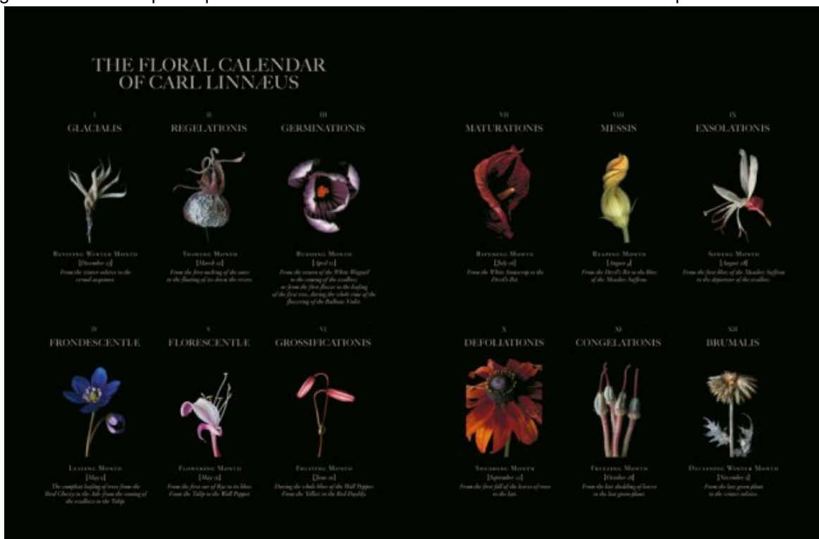
Herbarium Amoris © Edvard Koinberg

La notion de sexualité chez les plantes a été inventée par le botaniste et médecin suédois Carl von Linné (1707-1778). À partir des 20 000 spécimens de sa collection, Linné avait réuni fleurs et plantes dans un Calendarium Florae et procédé à une classification systématique des espèces en fonction du nombre et de la disposition de leurs organes reproducteurs, faisant des parallèles imagés avec les organes sexuels des êtres humains. Très controversée en son temps, l'affirmation selon laquelle les étamines et les pistils des plantes sont le reflet des organes génitaux humains provoqua une « révolution sexuelle » dans la taxinomie botanique.