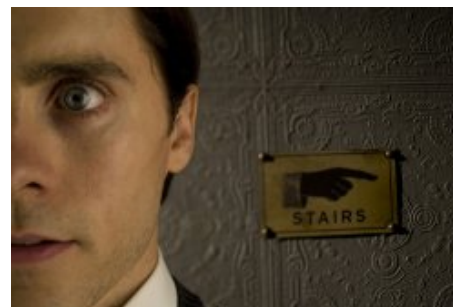
Mr Nobody de Chantal Thomine-Desmazes