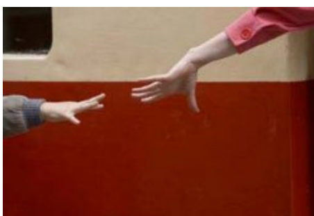
Mr Nobody de Chantal Thomine-Desmazes