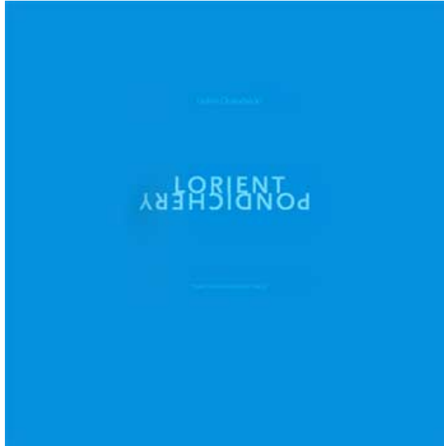
Lorient Pondichery de Didier Cholodnicki

Ni illustrations, ni stricts documents, ses images forment un libre parcours subjectif, ancré dans " la vie moderne" et agencé dans une forme de rapprochement poétique des deux villes.