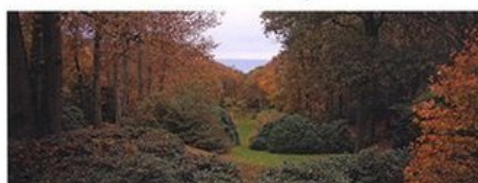
EDITIONS MUSEUM BARRAL

Itinéraires d'un jardinier de Pascal Cribier