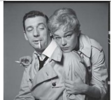
Mise en scène de Richard Avedon