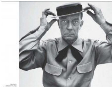
Mise en scène de Richard Avedon

John Lahr, auteur et critique, porte un regard pertinent et admiratif sur la carrière du photographe. Quatre artistes Mike Nichols, André Gregory, Mitsuko Uchida, Twyla Tharp apportent des témoignages vivants et sensibles de leur collaboration avec Avedon.