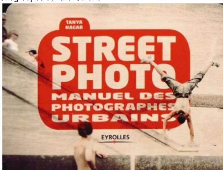
Street photo : Manuel des photographes urbains de Tanya Nagar, Charles Robert

Accessible à tous, cet ouvrage fournira les bases aux amateurs débutants qui veulent découvrir la photo de rue et constituera une précieuse source d'inspiration pour les photographes urbains chevronnés, notamment grâce aux témoignages de spécialistes regroupés dans la Galerie.