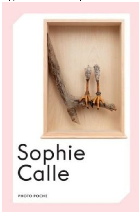
Sophie Calle : Photo Poche de Sophie Calle

Si elle choisit méthodiquement les expériences à vivre, la "faiseuse d'histoires", selon l'expression d'Hervé Guibert, n'a pas peur de dévoiler ses amours déçues ou la douleur exquise des absences. Avec un certain goût de la mise en danger, l'artiste s'est évertuée à dévoiler des vies autant qu'elle s'est elle-même exposée. Ceci dans le but de mettre en évidence ce que des existences en apparence ordinaires peuvent avoir d'extraordinaire.