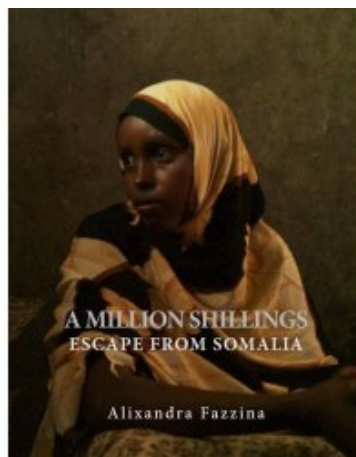
A Million Shillings : Escape from Somalia de Alixandra Fazzina

Récemment choisi comme le talent à surveiller pour 2008 par The Independent Magazine Photo Editor Nick Hall. Ses oeuvres ont été publiées au niveau international, y compris un article sur le trafic illicite de migrants en provenance de la Somalie à travers le golfe d'Aden vers le Yémen dans The Sunday Times Magazine en Janvier 2008, ainsi que dans les publications internationales The Guardian - Observer, The Telegraph, de Stern, Newsweek, NY Fois, De Zeit, Corriere et El Mundo.